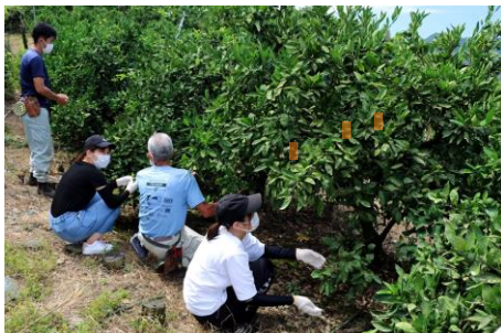
柑橘収穫体験やみかん山整備体験

みかん農家の女性を中心となって、自家製柑橘を使った加工品づくりに取り組むグループ「みかんの花工房」。そのメンバー宅にお邪魔して、日本農業遺産に認定された柑橘栽培の現場で、収穫体験や生ジュース搾り体験ができるものです。さらに、日本で唯一マーマレードの世界大会が開かれる当地で、収穫した柑橘等を使ったオリジナルのマーマレードの食べ比べができます。