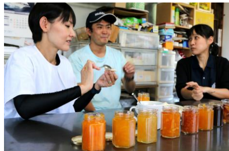
マーマレードの食べ比べ