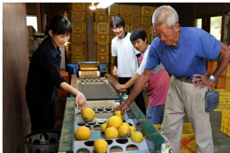
バックヤード見学