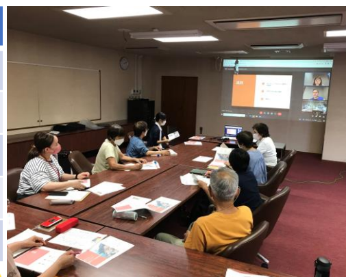
第1回目(9月27日) オンラインセミナーの様子。