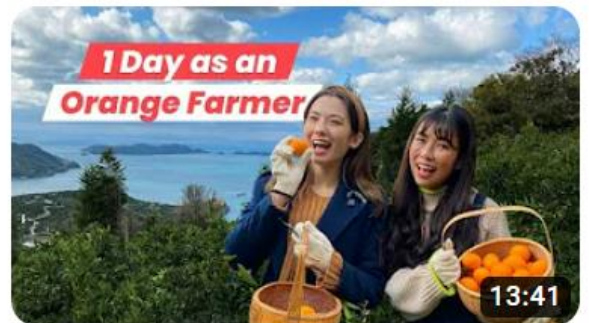
A Day at a Mandarin Orange Farm in Ehime, Shikoku

YouTubeチャンネル「Japan by food」で「柑橘収穫体験&マーマレード作り体験」のPR動画（13分程度）を観ることができます。「A Day at a Mandarin Orange Farm in Ehime, Shikoku」で検索して是非ご覧ください！