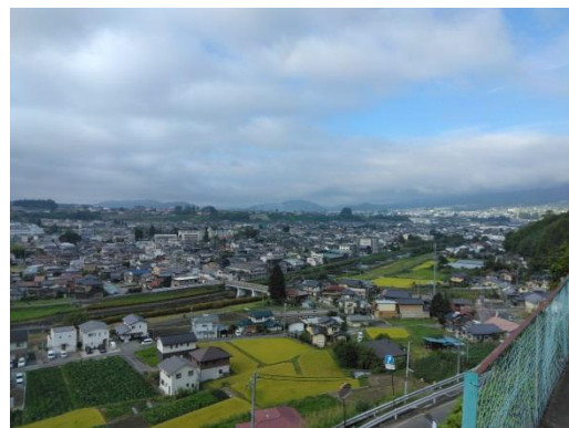
「りんご並木と人形劇のまち」として有名な長野県飯田市。人口は約9万6千人

民家拡大に成功している徳島県の「そらの郷」では、職員が目標を定めて行政と協力して民家を継続して訪問しているとのことでした。